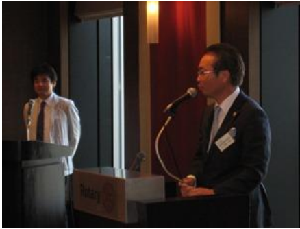
梅澤会長予定者ご挨拶とクラブテーマ発表