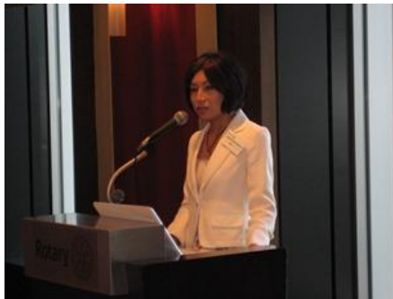
委員会報告① 愛知クラブ運営管理委員長