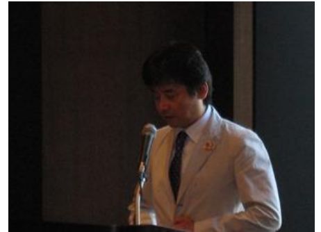
島谷幹事による幹事報告