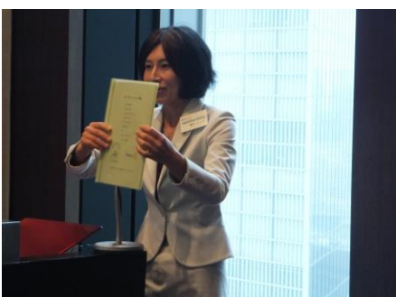
委員会報告① 愛知クラブ運営管理委員長