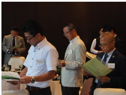
ロータリーソング斉唱