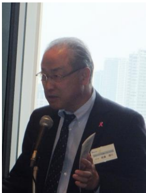
朝倉会員 ロイヤルパークホテルザ羽田オープンのご案内。

本日の参加者の全員が立候補で決まったチャーターナイト準備委員会の役割分担。やる気のあるみなさまで今後が心強いです!