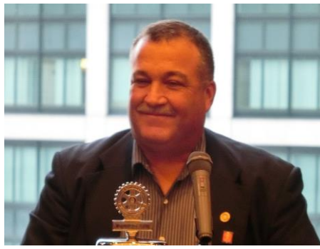
マイクペリン会員