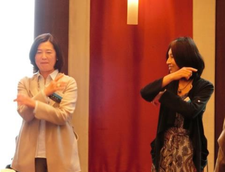
山岡ソングリーダー