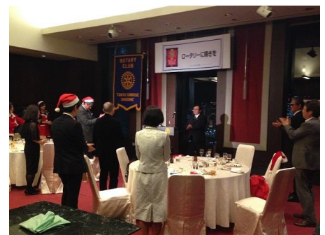
岩田様による一本締め