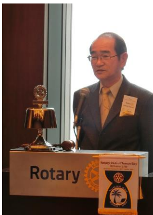
東京世田谷 RC 大黒会長