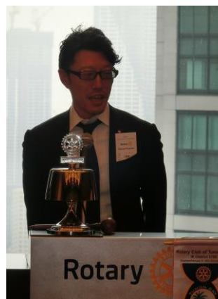
東京世田谷 RC 三富幹事