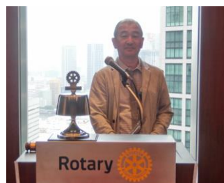
鹿島会員増強委員長