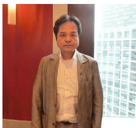
立堀社会奉仕委員長