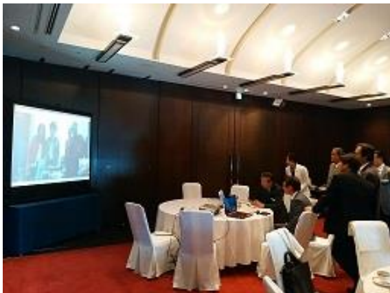
スカイプミーティングの様子