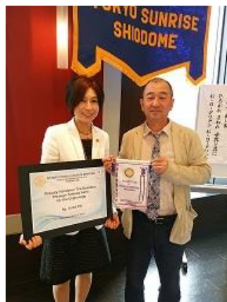
愛知会員・鹿島会員