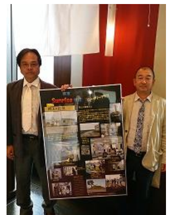
立堀会員・鹿島会員