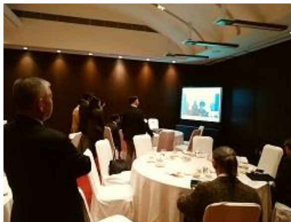
ジャカルタ・メンテン RC との 第2回スカイプミーティング