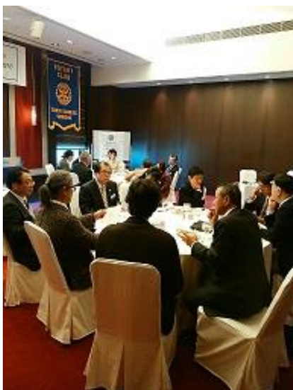
クラブ協議会の様子