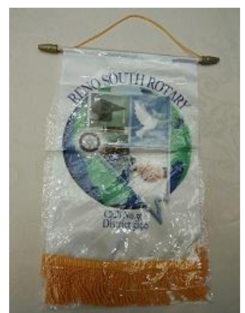
RENO SOUTH RC のバナーが届きました