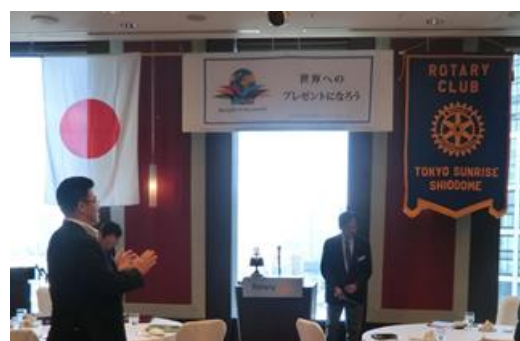
斉唱「四つのテスト」