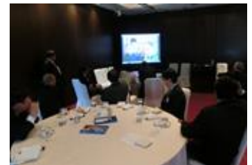
ジャカルタメンテン RC スカイプミーティング