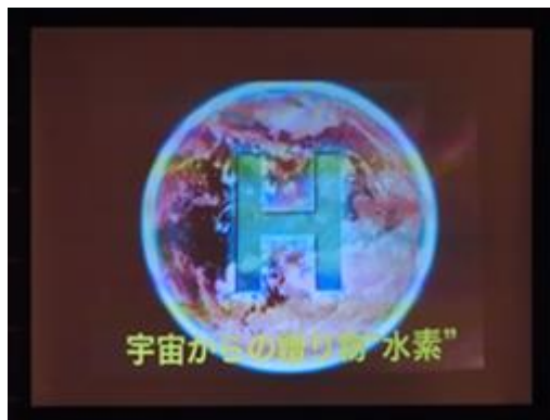
卓話「宇宙からの贈り物」