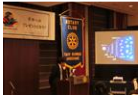
卓話「宇宙からの贈り物」