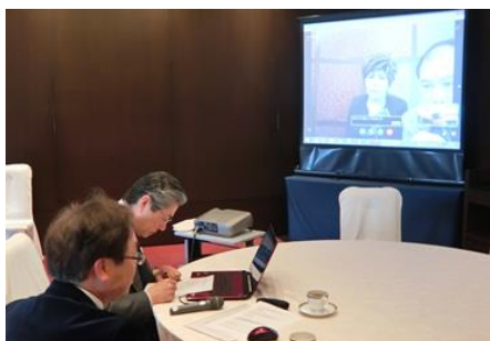
メンテンRCスカイプミーティング