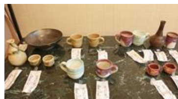
昨年 10 月親睦旅行の陶芸作品