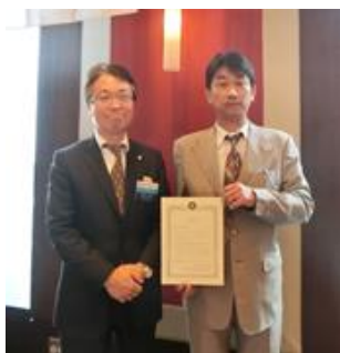
梅澤会長 坂井新会員