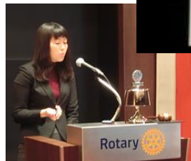
卓話「オークションの世界」