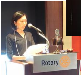
卓話「オークションの世界」