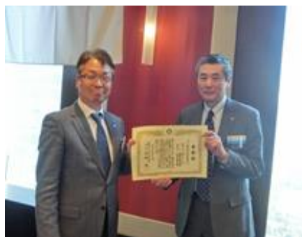
ロータリー財団表彰 ロータリー財団寄付三部門 地区目標達成クラブとして受領