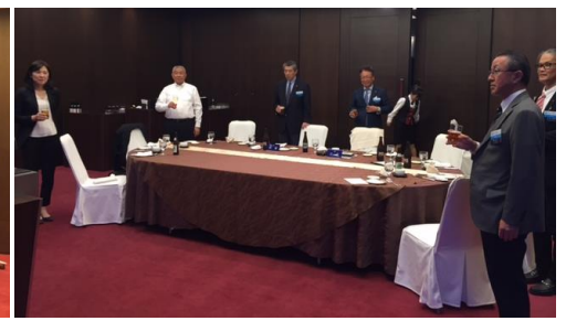
親睦例会 乾杯の様子