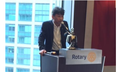
イニシエーションスピーチ（坂井会員）