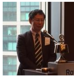
熊本グループ幹事