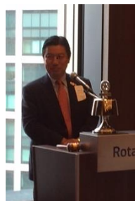
門馬地区副代表幹事