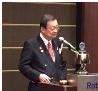
大槻ガバナー：卓話