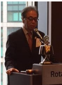
山田地区代表幹事