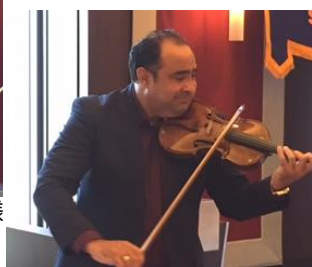
『ハンガリー舞曲第5番』