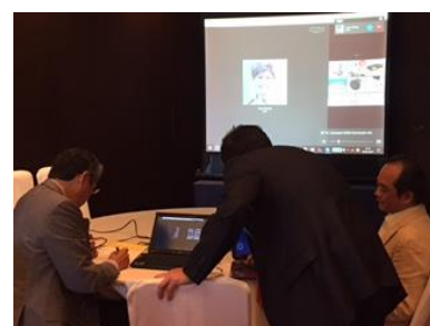
スカイプミーティング