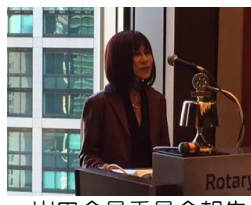
岩田会員委員会報告