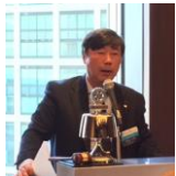
奉仕プロジェクト委員会 熊谷会員