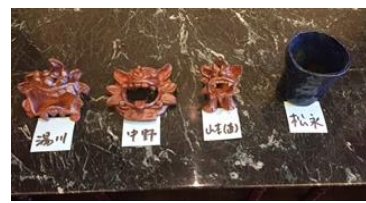
宮古島での作品が届きました