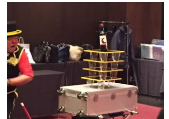
クロス引きのパフォーマンス