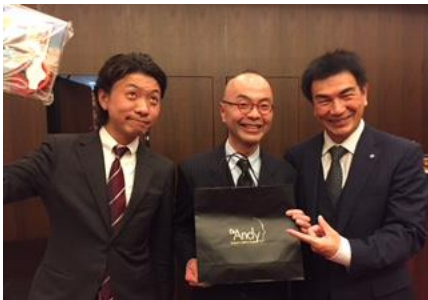
原会員も最後にビンゴ！