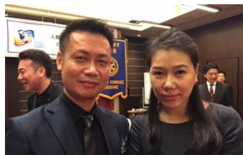
沈会員とご主人様