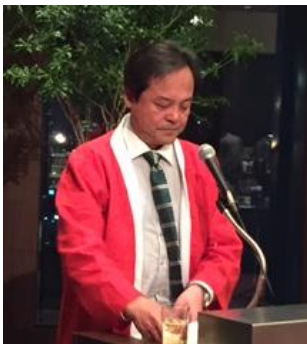
ビンゴ大会司会立堀会員