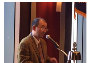
委員会報告鹿島会員