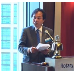
ニコニコBOX 立堀会員