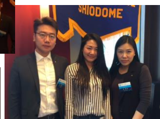
金会員 ソロン様 沈会員