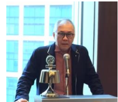
アト・リュウ・ウオ様