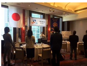
ソングリーダー 愛知副会長