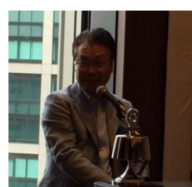
梅澤会員増強委員長