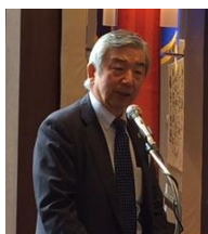
西澤民夫ガバナー補佐