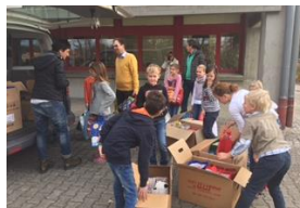
小学校でのクリスマス奉仕の様子