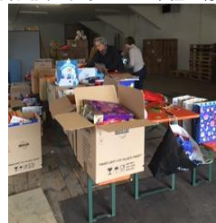
婦人会のクリスマス奉仕の様子