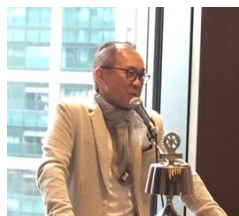
アト・リュウ・ウォン様