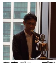
新家グループ幹事