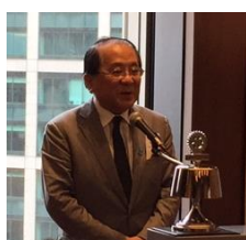
森村ガバナー補佐