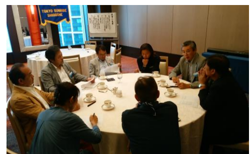
クラブ協議会の様子