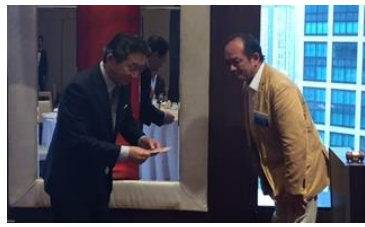
手代木様よりニコニコの贈呈