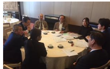
クラブ協議会の様子