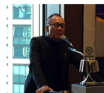
アト リュー・ウノ様