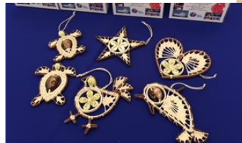
寄付を頂いた方へのギフト