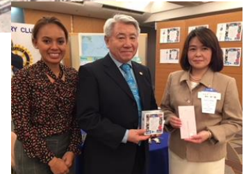
東京恵比寿 RC より