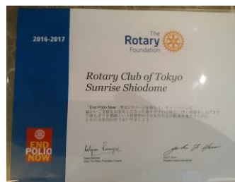
エンドポリオの感謝状