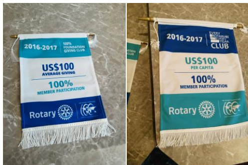
湯川会長年度バナー