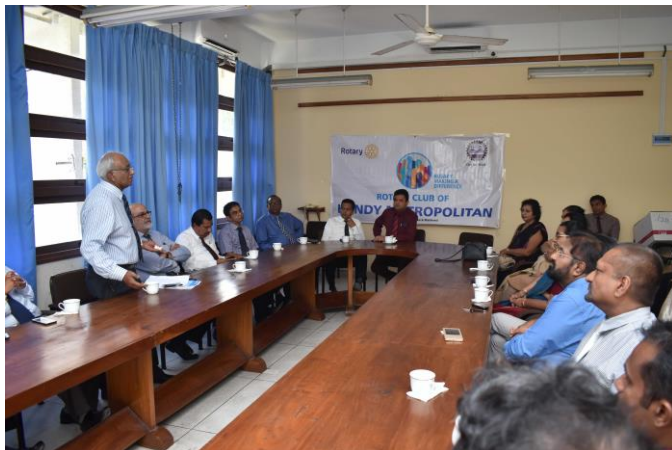
超音波スキャナー装置・機材贈呈式の様子