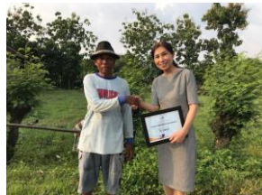
土地のオーナーさん