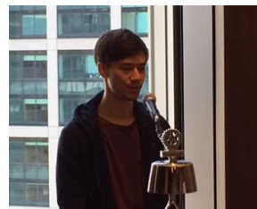
Frenkenberger Bjol Rene 様