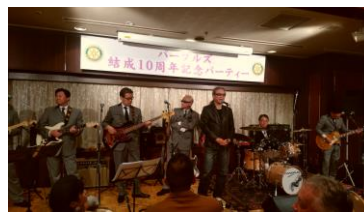
パープルス結成 10 周年記念パーティー