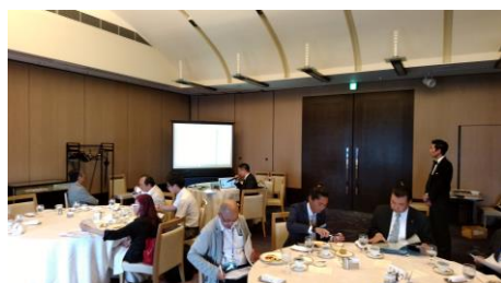
五十嵐会員イニシエーションスピーチ