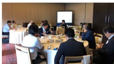
市川会員イニシエーションスピーチ