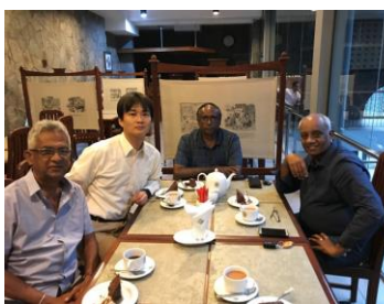
キャンディのロータリアンの方々と