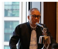
アト・リュウ・ウオ様