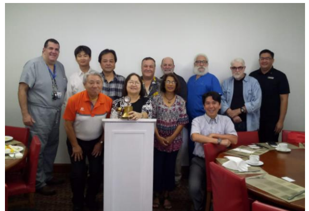
グアムサンライズ例会に出席いたしました