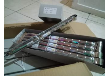
ゴミ拾いのためのトングを 100本寄贈しました