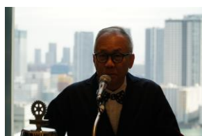
アンドリュー様会員