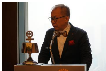
卓話者紹介 アソシエイト会員