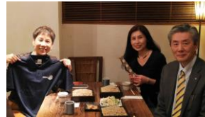
メンテン マリ・アヌ会長と 湯川会員、愛知副会長と会食